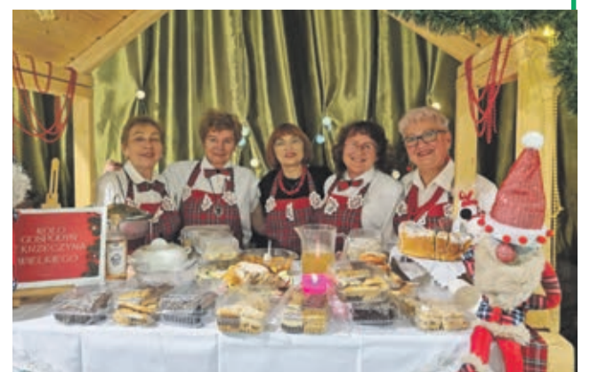
Koło Gospodyń Krzczyna Wielki