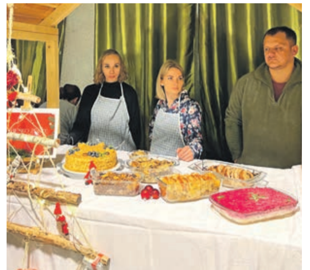
Niebiesko - Żółte Gary