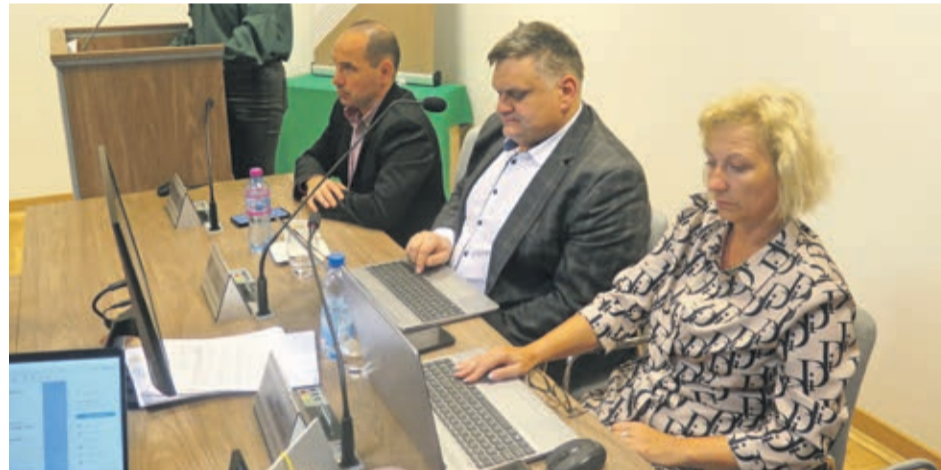
Prezydium rady Gminy Lubin

Urzędu Statystycznego wynosi 74,05 z 1 dt. Jednocześnie ustalono nowe wysokości stawek podatku od środków transportowych na rok 2023, które zostały zwaloryzowane. Ten podatek obejmuje samochody ciężarowe, przyczepy, autobusy czyli działalność firm trans-