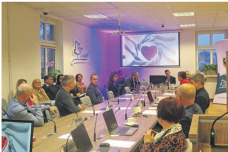
Uroczystość odbyła się w obecności radnych, nadano jej wyjątkowy klimat, dzięki występowi muzycznemu studentki wokalistyki jazzowej.

Dobroczynność ma wiele twarzy, a każde bezinteresowne działanie