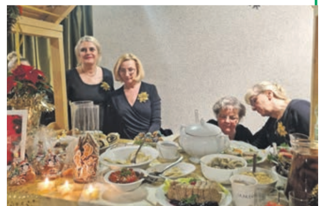
Koło Kobiet Niezależnych Babeczki